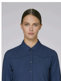
Stella Inspires Denim